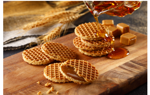
▲グランプリ 受賞ロゴ ▲キャラメルサンドメープルワッフル（大）